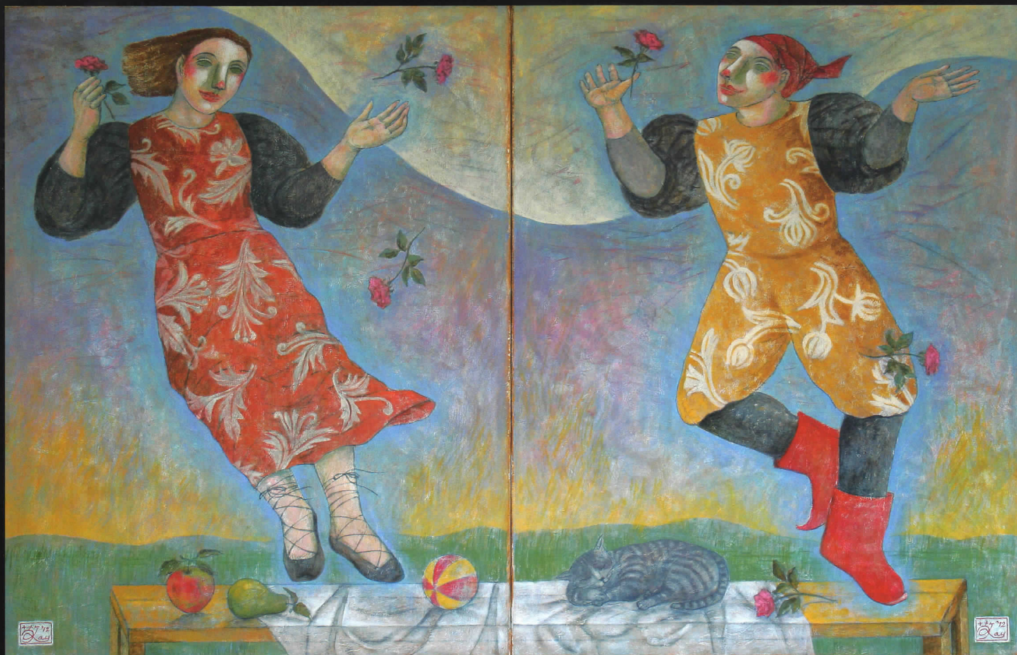
浮遊 Floating in the air 2012 二連画 Diptych Acrylic 2x(90x70cm)