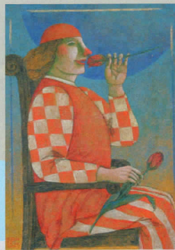
チューリップ Tulip 2008 Acrylic (70x50cm)