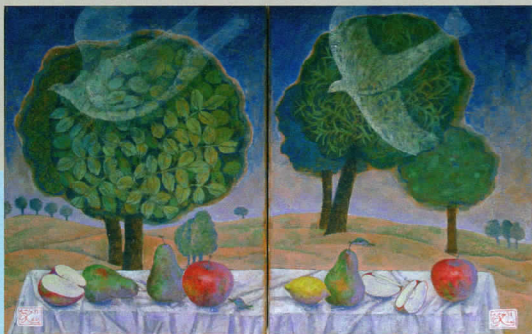
鳥飛ぶ Bird flying 2009 二連画 Diptych Acrylic 2x(50x40cm)

今世界で必要とされている、この古くて新しいルネサンス精神に基づく美と人間性の回復と再生を独自の手法による作品に籠め、アートの発信地であるニューヨークから世界に向けて発信したいと、吉屋はNY展に大きな夢と希望を託しています。