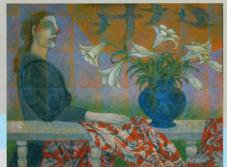
晩夏 Late summer day 2012 Acrylic (60x80cm)