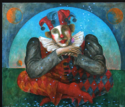
月夜のピエロ Pierrot in moonlit night 2007 Acrylic (60x70cm)